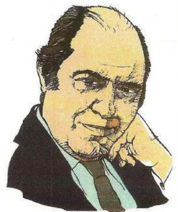
El Pensamiento de José Antonio Marina

H ACER de la filosofía casi un juego debe ser habilidad propia de quien, como el autor de esta Crónica del Pensamiento , disfruta con la enseñanza y, como buen catedrático de Instituto, plantea las lecciones con una especial pedagogía cuajada de enigmas. De este modo en los alumnos se despierta la inquietud necesaria para el aprendizaje. De la misma manera, los libros de José Antonio Marina son fáciles de leer aunque obligan a reflexionar y a plantearse las grandes cuestiones como si fueran problemas cotidianos de pronta resolución. Tiene la habilidad de poner la filosofía, tan denostada como materia de enseñanza, al alcance de la mano. La originalidad de su búsqueda filosófica queda plasmada en su último libro, El misterio de la voluntad perdida , editado por Anagrama, del que en estas páginas se recoge un segundo y último fragmento.